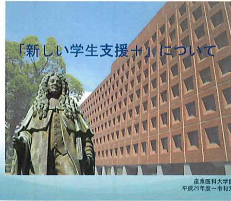
産業医科大学医学部 平成29年度～令和元年度